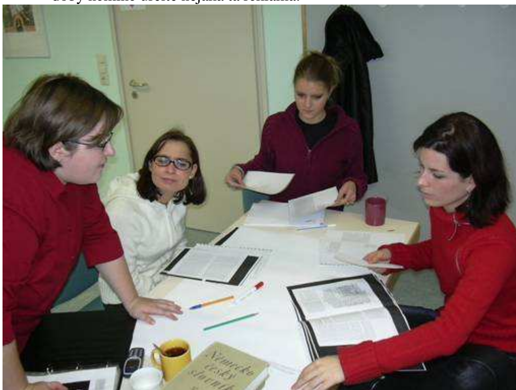
Lukášův Sojka – bulvár