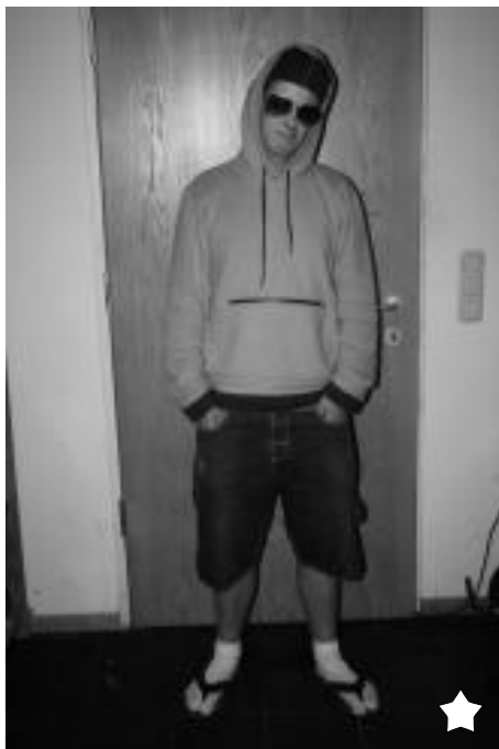
Ponožky v žabkách, cože?

Svou velkou hollywoodskou premiéru v hlavní roli Gaisthalu Klasik má za sebou Léňa. A můžeme skutečně říct, že z naší princezny se stala královna, ba dokonce carevna. Léňa nejen že určovala, kudy cesta vede v rámci svého šéfování tábora, ale udávala i směr co do vybraného stylu. Léňa se rozhodně nebojí odvázat a kombinovat. A v čem spočívá její tajemství? Ano, Léňa se nebojí recyklovat a ráda zamíří do sekáče. Přičemž platí, čím pozitivější název, tím vyšší kvalitka, tzn. sekáč „Pohoda“ je např. zárukou hvězdných modelů. Mně nezbyvá než souhlasit!!