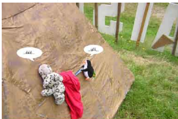
První krůčky na pyramidě.