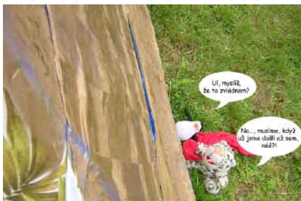
Tígi a Tuki před pyramidou.