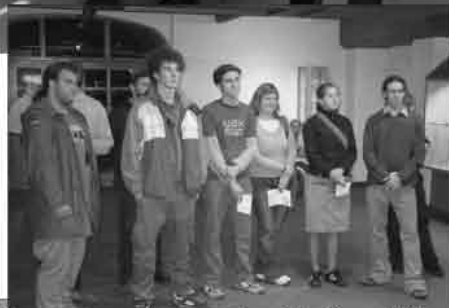
Symposium Furth im Wald