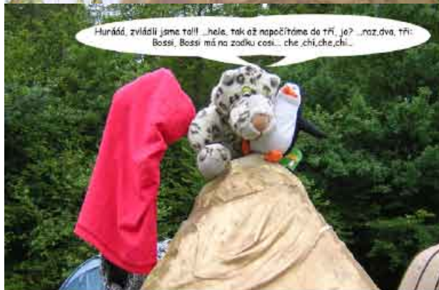
Tuki a Tigi na vrcholu své cesty Gaisthaleni