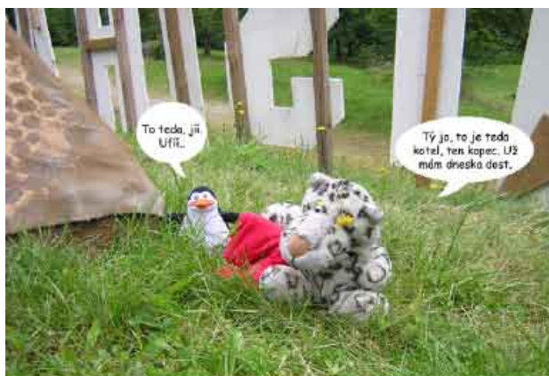
Tígi a Tuki se již pomalu blíží svému cíli, ale ještě je čeká to nejtěžší – výstup na pyramidu.